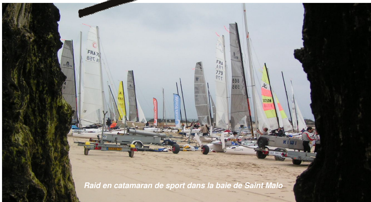
Raid en catamaran de sport dans la baie de Saint Malo