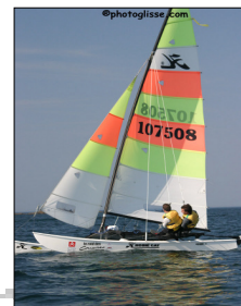
Hobie Cat 16

Longueur: 5.11m Largeur : 2.41m Surface de voile : 20.26m 2 Poids : 145kg